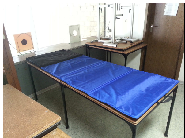
neu, Juni 2017

Nach jedem Benutzen musste der Schütze erst einmal den Staub von seiner Schießjacke klopfen, der während dem Liegen durch Abrieb entstand. Der Vorstand entschied daher 2017 endlich den dringlichen Kauf neuer Schießmatten.