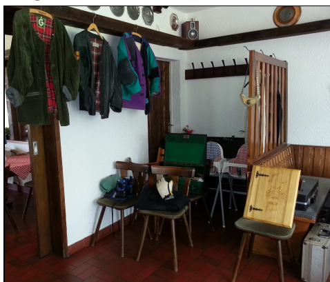
Ausrüstung und Vereinsexponate