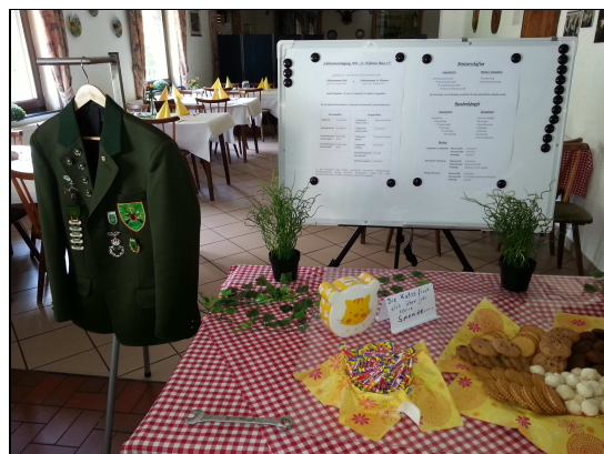
Vereinsuniform und Info-Tafel