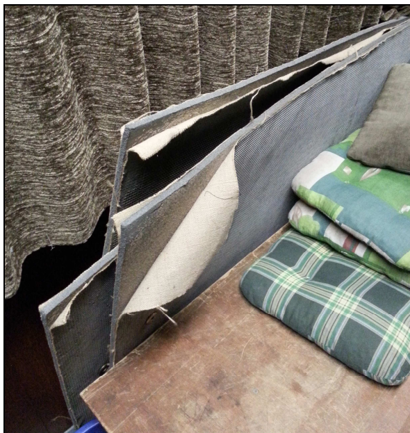
alt, Dezember 2016

Regelmäßige Investitionen sind immer eine notwendige und auch oft eine sinnvolle Angelegenheit. So bei den Schießmatten für den Liegendanschlag. Unsere Matten waren seit Jahren ausnahmslos in einem desolaten Zustand. Sie lösten sich auf, verloren an Substanz.